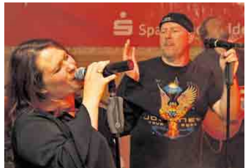
Auf der Bühne der Sparkasse im Gasthaus „Zur Krone“ herrschte Hochbetrieb. Hier sorgten „Six days later“ für Stimmung.