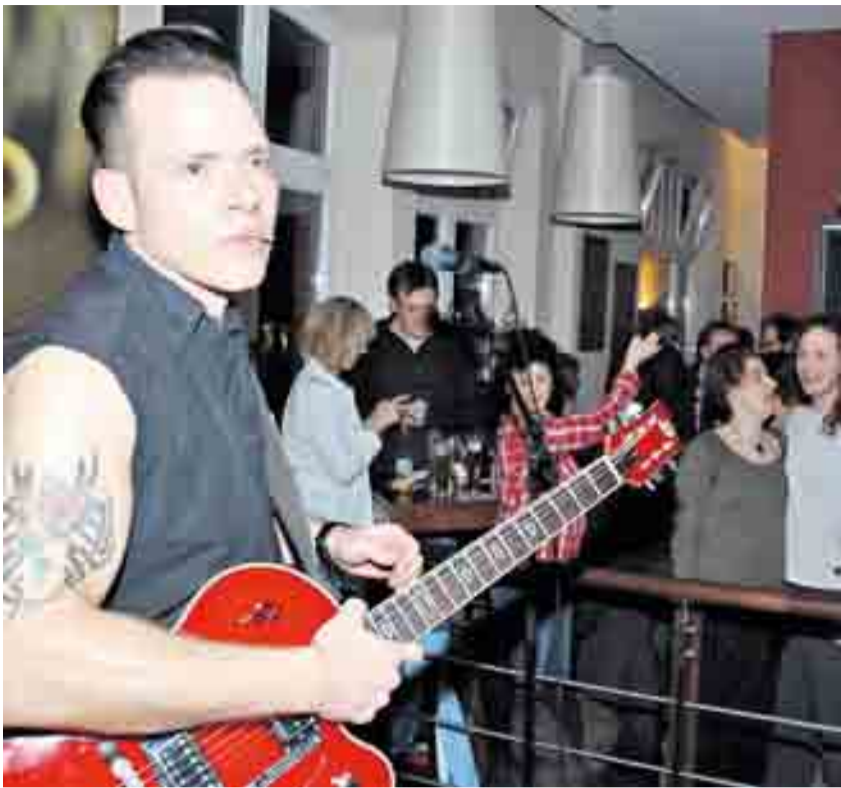
Das rockt: „Frankfort Special“ sorgten im Café Plücker für waschechte Rock-‘n’-Roll-Klänge und brachten das Publikum in Schwung.