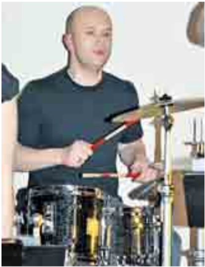
„Magic Flair“ im CorVita.