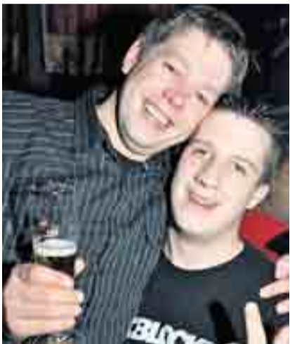
Westfalen wissen, wie man feiert!