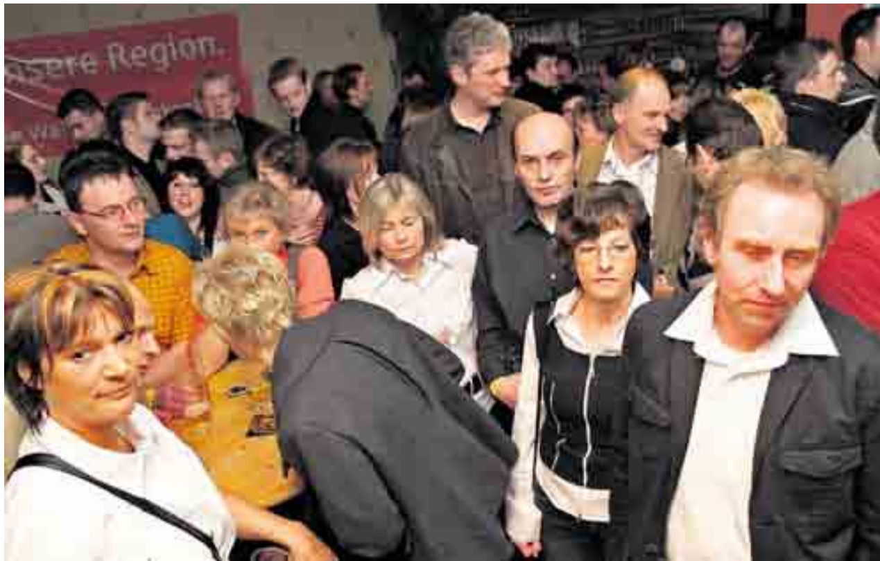
Alle Generationen feierten mit: Wie hier im Gasthaus „Zur Krone“ trafen sich viele Live-Musik-Fans auf ein Bierchen. Erst am frühen Morgen klang das erste Korbacher Kneipenfestival dann aus.

Lassen Sie den ersten Korbacher Nightgroove noch mal Revue passieren: In unserer Bildergalerie unter www.wlz-fz.de finden sie viele Fotos vom großen Kneipenfestival.