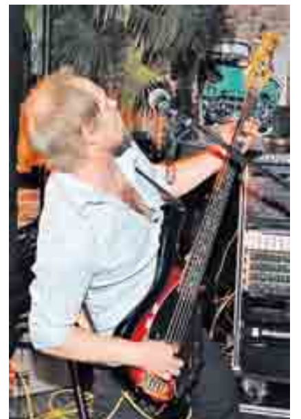
Rauchige Rockerstimme: Forroxx heizten ihren Gästen ein.