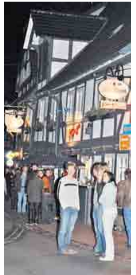
Volle Straßen in der Altstadt.

Am 19. April laden dann die Frankfurter Kneipenbesitzer zum Nightgroove ein.