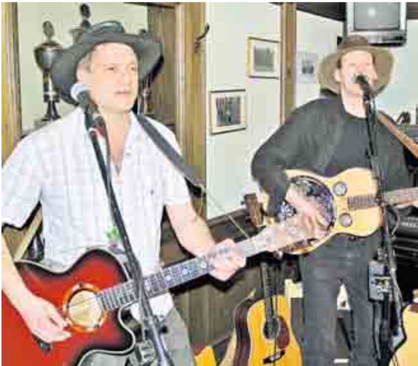
Das gut aufgelegte „Duo Coincidence“ spielte im Gasthaus „Kilian“ Folk, Rock, Pop und Rythm 'n' Blues.