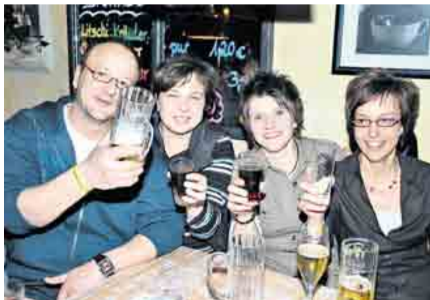
Hoch die Tassen: „Dieses Kneipenfestival muss es auf jeden Fall öfter geben“, war sich diese Gruppe einig.