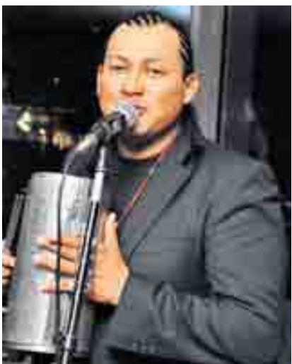
„Tanze Samba mit mir ...“