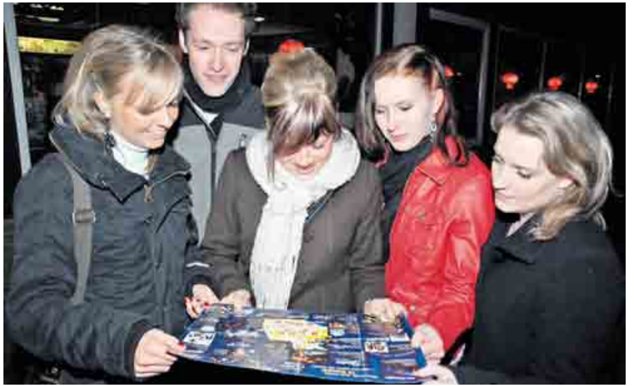
Wo geht es als Nächstes hin? – Der große „Night groove“- Orientierungsplan durfte beim Streifzug durch die Stadt nicht fehlen. Schließlich wollte keiner etwas verpassen.