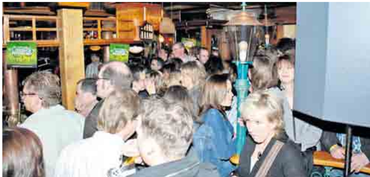
Wie hier im „Querbeet“ gab es in vielen Kneipen kein Durchkommen mehr. Wer einmal einen Platz an der Bar ergattert hatte, gab ihn so schnell nicht mehr her.