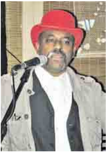
Samba- und Salsaklänge sorgten im „El Torito“ für Stimmung.